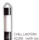
CHILL LANTERN ¥2,000 (with tax)

アウトドアの販売店として、たくさんの商品をみてきたMaverickのオリジナル商品は、どんな人にも使いやすい馴染みの良さと、かゆいところに手が届く利便性の高い商品を厳選してきました。「デザインも価格も機能性もどれもいいものを選びたい」そんなニーズに答えていける商品を展開していきます。